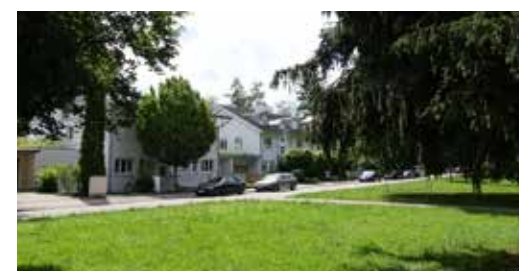
Blick in die Uhdestraße