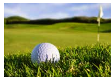
Golfen am Münchener Golfclub e.V.