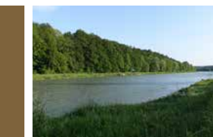
Die Isarauen - Erholung pur