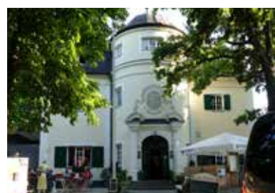
Gasthaus und Biergarten Zum Hirschen