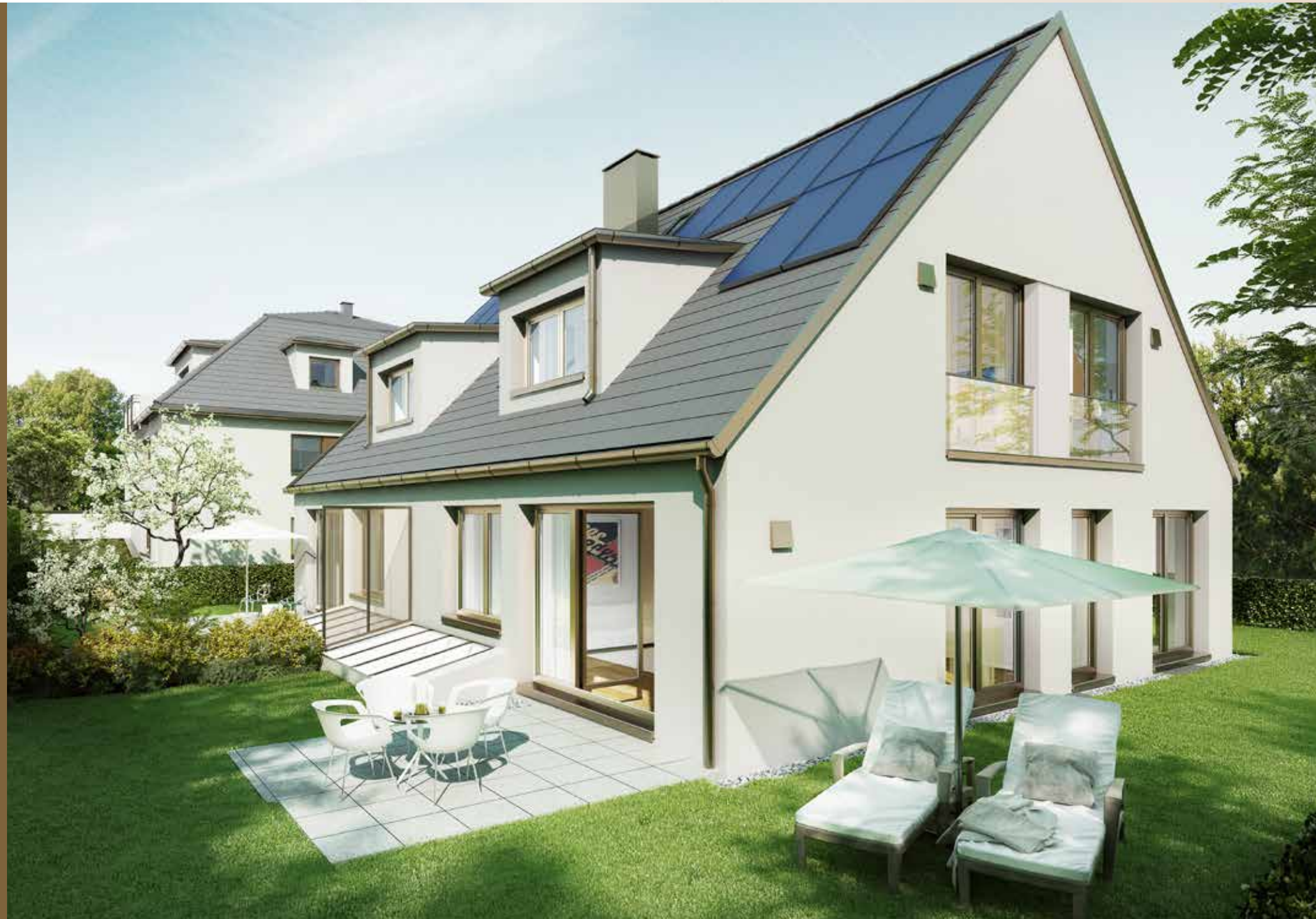
3D-Visualisierung: Blick auf das Gartenhaus

Das Gartenhaus besteht aus zwei Einheiten mit jeweils eigenem Hauseingang und großzügigen Grundrissen mit 5 Zimmern auf 2 Etagen. Mit jeweils ca. 132 m 2 Wohnfläche und Raumhöhen im EG und DG von 2,70 bzw. 2,80 m bieten die Wohnungen viel Raum zur Entfaltung für die ganze Familie. Hinzu kommt das Untergeschoss mit ausgebautem Hobbyraum mit Fußbodenheizung und Parkettboden sowie guter Belichtungssituation.