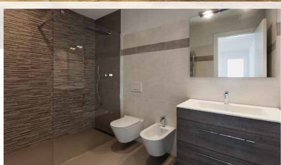
Hochwertige Sanitärausstattung (Beispiel)

3D-Visualisierung - Ausstattungsbeispiel